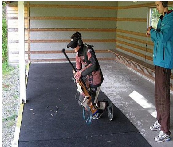
Skyttere i aksjon, foto: Halvor Rostad