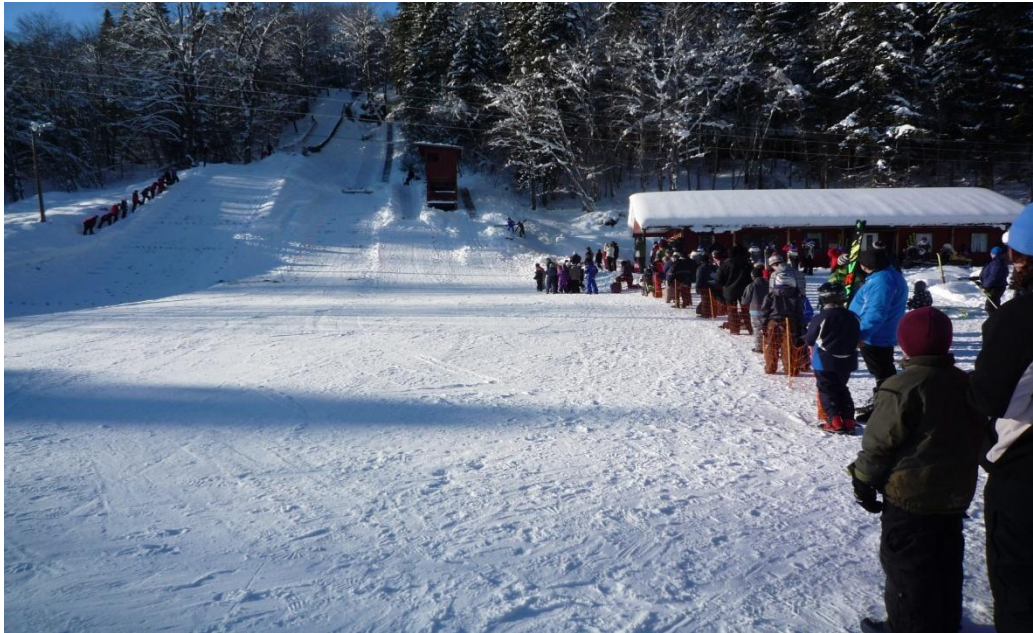
Gaarderbakken i Veggli, foto: Per Inge Myrann

Se vedlegg for resterende anlegg. Dette er anlegg som er registrert ved anleggsregisteret til idrettsanlegg.no , noe av det kan være utdatert.